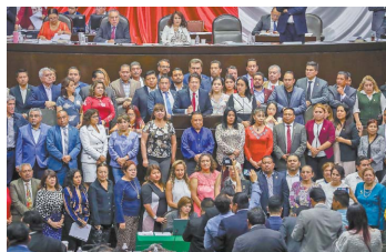
Los 288 diputados de Morena recibieron el tríptico para unirse a la asociación de legisladores de la Cuarta Transformación.

fortalecer aún más al Ejecutivo federal, pasar por encima de otros poderes y vulnerar todavía más el federalismo, además de crear esquemas de adopción en autoritarismo e intolerancia. "Resulta preocupante que con el pretexto de esta organización se pretenda fortalecer aún más al Ejecutivo federal, por encima de los otros