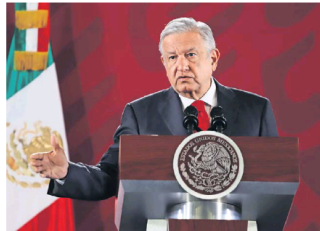
Expertos consideran que hay signos de concentración de poder político en todos los niveles de gobierno, incluido el Ejecutivo federal.

Finalmente, Porfirio Muñoz Ledo reiteró que en México se ha asentado un megapresidencialismo